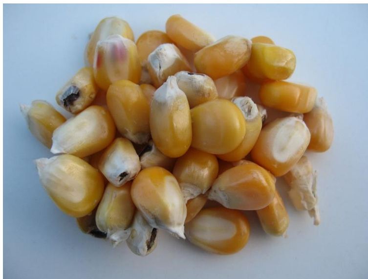
BILLEDE 11. BILLEDET VISER DEN SORTE PLET PÅ KERNERNE, DER HVOR DE SIDDER FAST PÅ SPINDELEN. DEN SORTE PLET PÅ KERNERNE DANNES, NÅR INDLEJRINGEN AF STIVELSE I KERNERNE ER STOPPET.