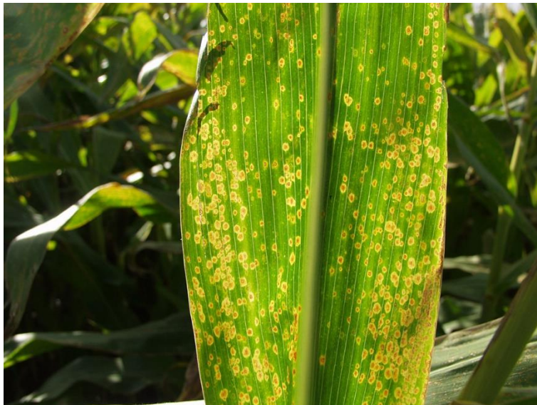
BILLEDE 5. ØJEPLETSVAMP I MAJS SES ISÆR VED FORFRUGT MAJS OG SAMTIDIG REDUCERET JORDBEARBEJDNING. SYMPTOMERNE ER ISÆR TYDELIG, NÅR MAN HOLDER BLADET OP IMOD LYSET.

Majs kan blive angrebet af bladpletsvampene majsbladplet ( Drechslera -arter) og majsøjeplet ( Kabatiella zeae ). Majsøjeplet trives under kølige (ca. 14-17 °C) og fugtige forhold, mens majsbladplet trives bedst ved lidt højere temperaturer (ca. 20-26 °C) og bladfugt. Bladpletterne ved majsbladplet er aflange og mørke-til lysebrune og kan også være mere grålige. Bladpletterne ved majsøjeplet er meget cirkulære, og især når bladene holdes op mod lyset er det tydeligt at se en gul zone omkring bladpletterne.. Angreb kan i visse år og marker være meget tabsvoldende selv ved sene angreb. Der findes kun begrænsede danske data for sorterens modtagelighed, og der er ikke set tydelige sortsforskelle i modtagelighed. Se Sortinfo.dk .