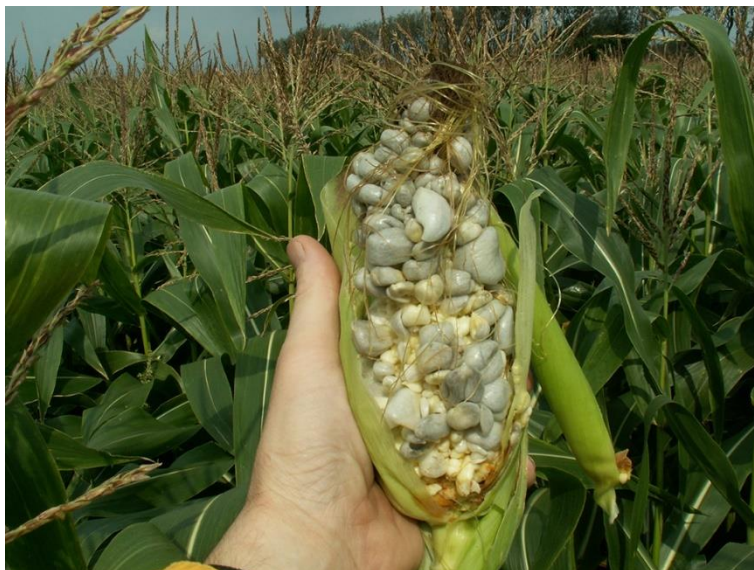
BILLEDE 4. SYMPTOMERNE ER GLINSENDE SØLVHVIDE GALLER, DER ER FYLDT MED SORTE SPORE.

I enkelte varme og tørre år kan majs angribes af majsbrand. Især svækkede planter angribes. Svampen kan overleve mange år i jorden, og der er ingen bekæmpelsesmuligheder. Bekæmpelse via sædskifte kræver mange år uden majsdyrkning. Svampesporerne kan spredes med vinden til nabomarker. Der er ingen risiko ved at anvende angrebne planter til foder, men foderværdien er nedsat.