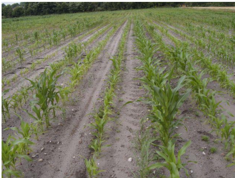
BILLEDE 1. DYRKNING AF MAJS PÅ SANDJORD FØRSTE ÅR EFTER FLERE ÅR MED KORNDYRKNING KAN GIVE UENS VÆKST I MAJS. EN AF ÅRSAGERNE KAN VÆRE SKADE AF HAVRECYSTENEMATODER PÅ MAJSRØDDERNE.

Er der kun få marker, der egner sig til majs, kan majs dyrkes i monokultur. På disse arealer kan der efter få år opstå problemer med rodukrukt som agerpadderokke, følfod, vandpileurt og tidsel. På lettere jordtyper kan der i første års majs efter flere år med korndyrkning forekomme dårlig vækst i majs, hvilket formentlig skyldes angreb af havrecystenematoder - også kaldet havreål. Havreål kan ikke opformerer på majs, men kan skade majsplanterne om foråret. Ved dyrkning af vårbyg i sædskifte med majs, bør der anvendes nematodresistente vårbygssorter.