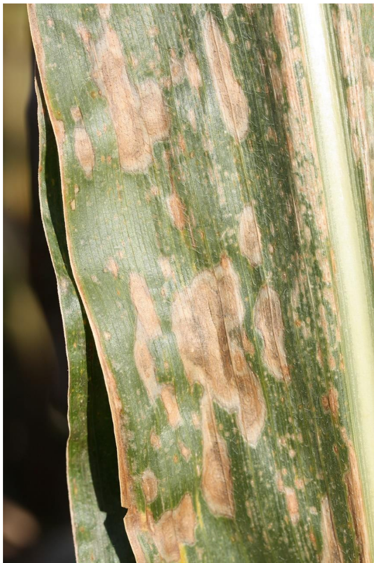
BILLEDE 6. MAJSBLADPLET.

Ved behov er en enkelt svampesprøjtning oftest tilstrækkeligt.