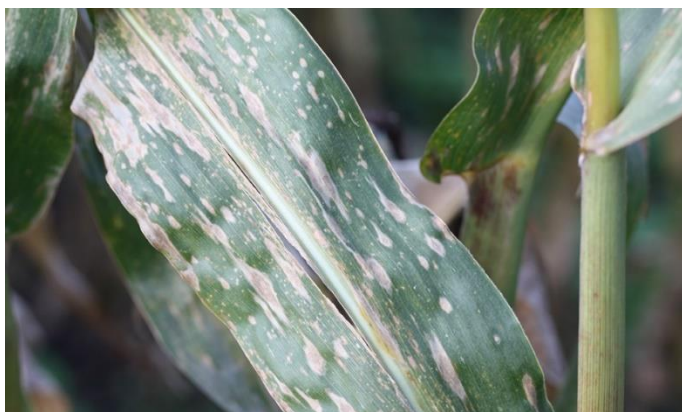
BILLEDE 7. MAJSBLADPLET. FARVEN PÅ BLADPLETTERNE KAN VARIERE FRA MØRKEBRUN TIL LYSEBRUN ELLER VÆRE MERE GRÅLIG.

Anvend med en konventionel sprøjte omkring 200-250 liter vand og brug f.eks. en 03 (blå) eller 04 (rød) lavdriftdyse.